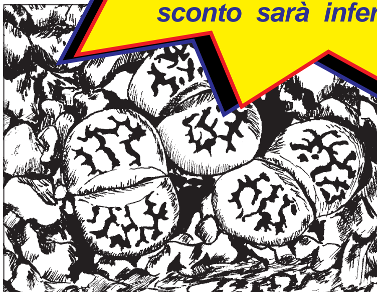
Lithops Karasmontana ssp. Bella C143 (coll. Reverberi)