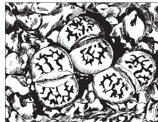
Lithops Karasmontana ssp. Bella C143 (coll. Reverberi)