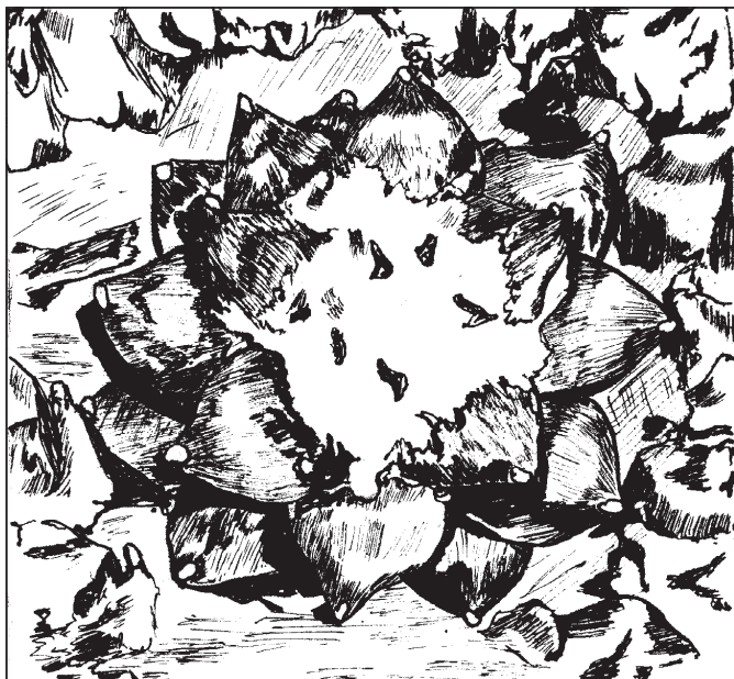
Ariocarpus Retusus (coll. Reverberi)