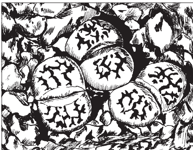
Lithops Karasmontana ssp. Bella C143 (coll. Reverberi)